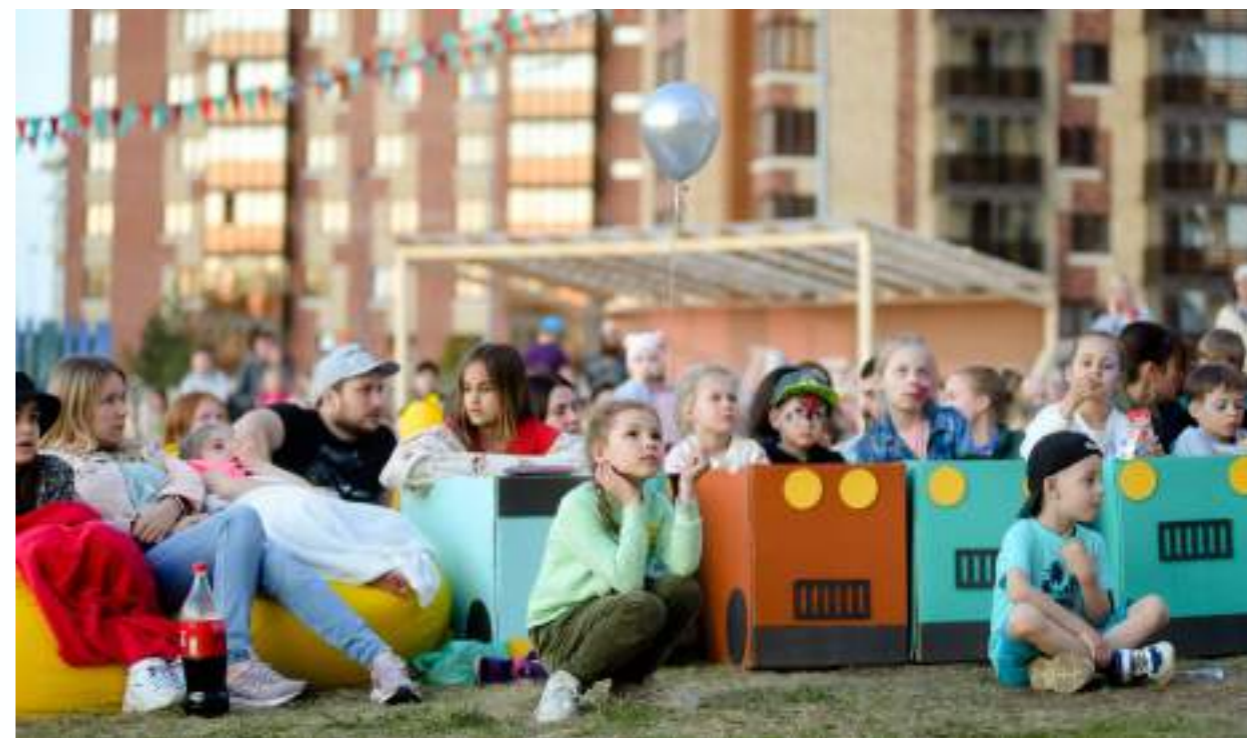
Посадочные места – картонные машинки