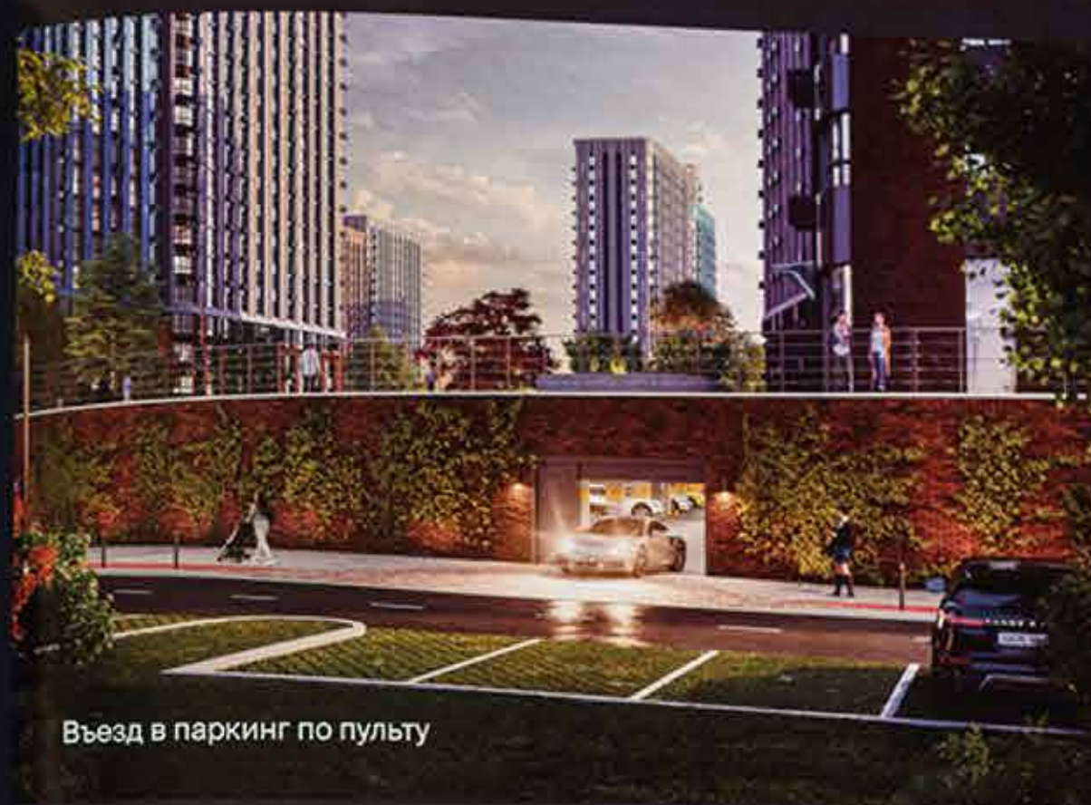
Въезд в паркинг по пульту

В паркинге 24/7 ведется видеонаблюдение, здесь автомобиль находится в абсолютной безопасности и полностью защищен от солнца, дождя и града. А вы экономите время и силы, ведь вам не придется каждый раз искать место.