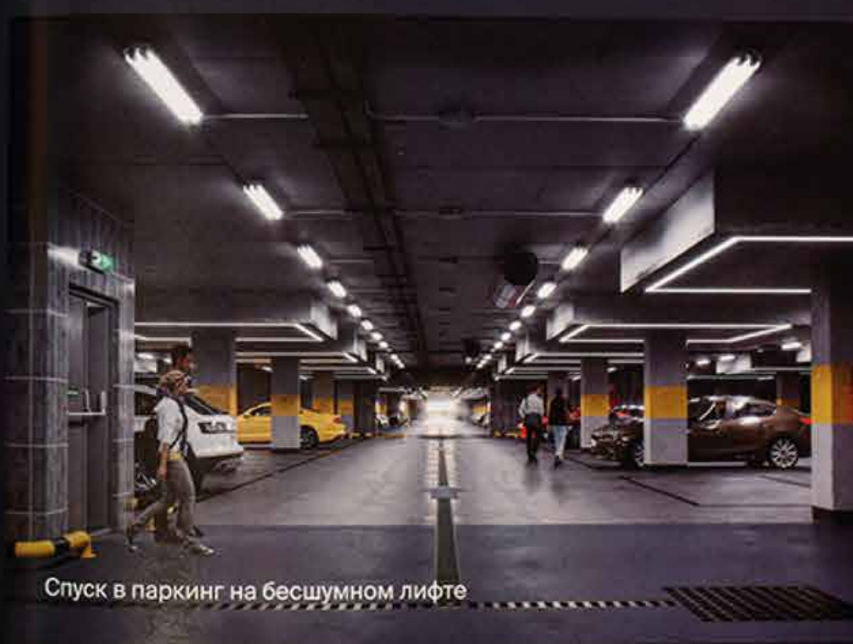
Спуск в паркинг на бесшумном лифте

Площадь индивидуального паркоместа - 13,8 кв.м. Длина - 5,3 м, ширина - 2,6 м.