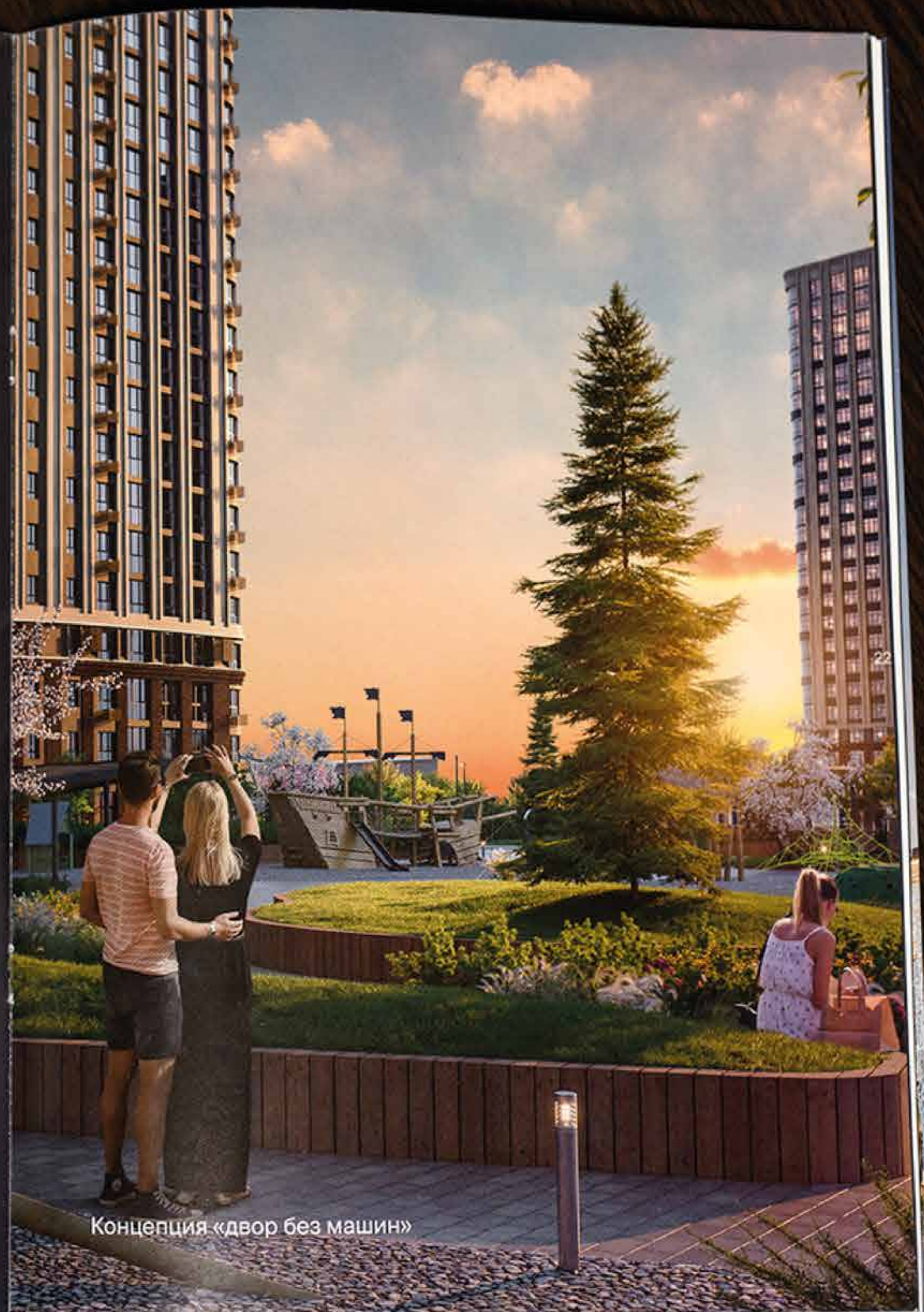
Концепция «двор без машин»