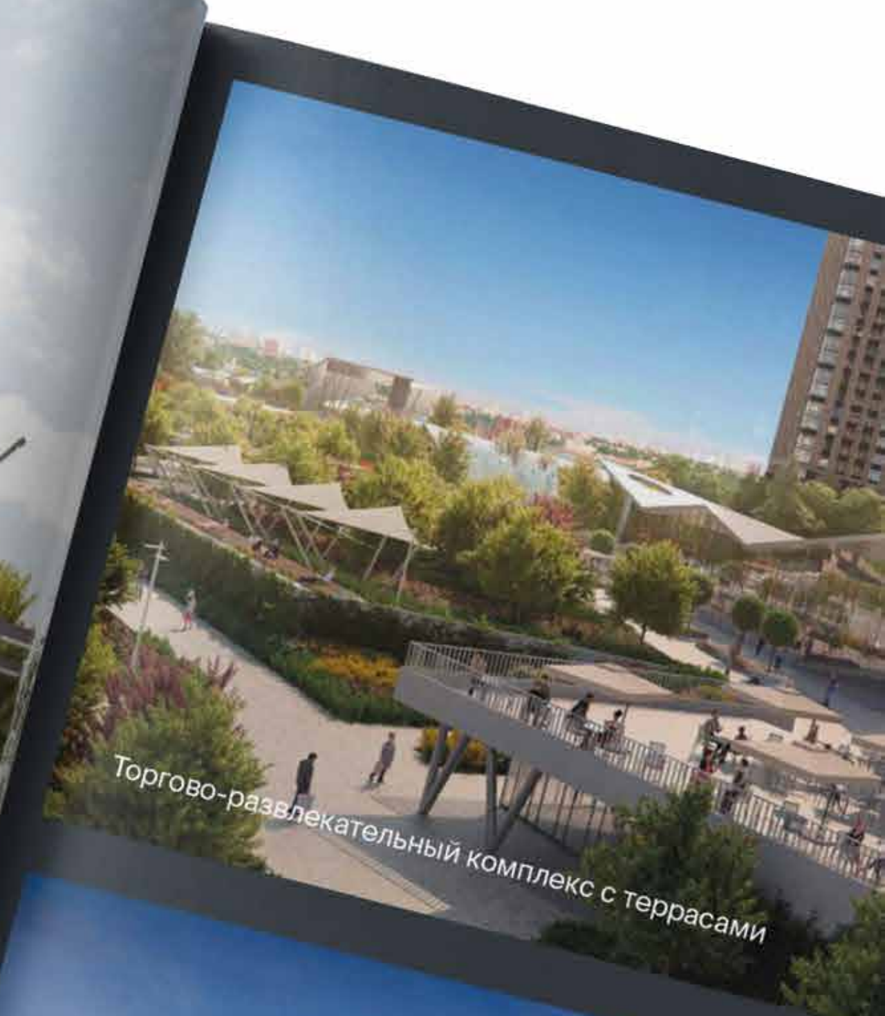
Торгово-развлекательный комплекс с террасами