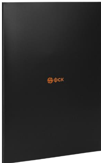
Папка из дизайнерской бумаги на магнитах для коммерческого предложения