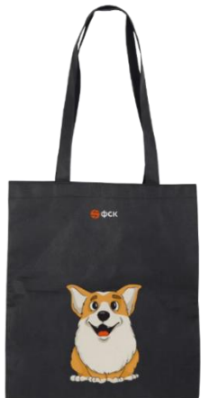
Сумка для детей