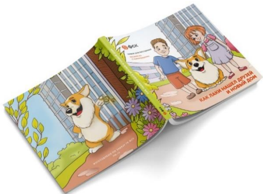
Раскраска для детей