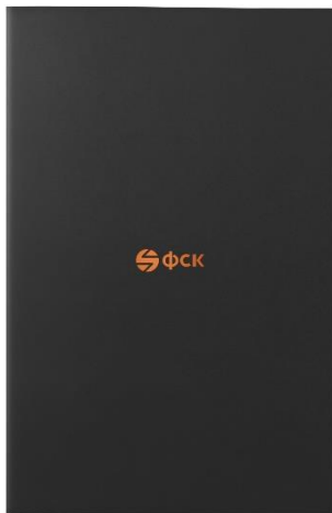
Тетрадь-блокнот для клиентов