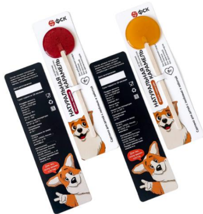
Леденцы для детей Запатентованная натуральная карамель с суперфудами без сахара, красителей, ароматизаторов, глютена, ГМО. В индивидуальной брендированной упаковке.