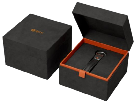
Подарочная коробка с брелоком и ключами от квартиры для новоселов