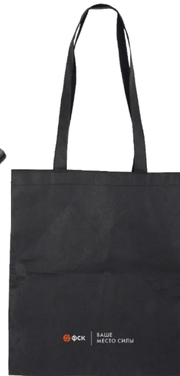
Сумка-шоппер для клиентов

Тираж: бумажные пакеты для клиентов - около 20 тыс. шт., кардхолдеры - около 2 тыс.шт. в год, ручки - около 15 тыс. шт. в год, сумки-шопперы - около 2 тыс. шт. в год.