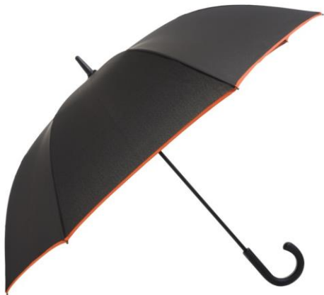
Зонт для клиентов