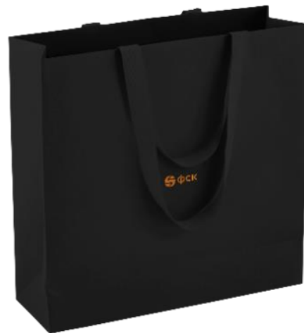
Бумажный брендированный пакет для новоселов