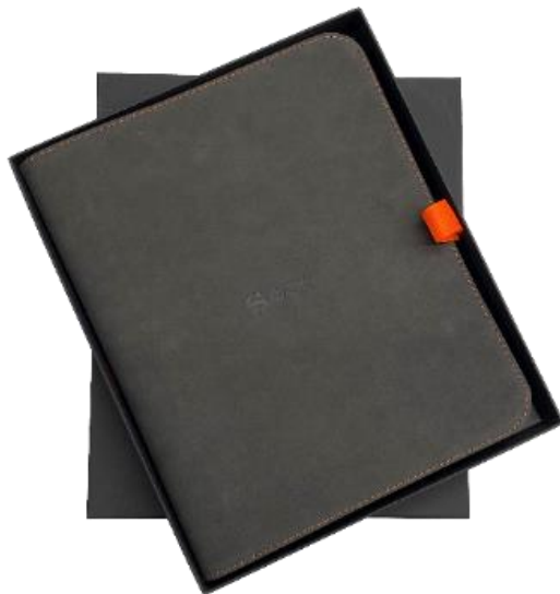
Подарочная коробка с папкой для документов от квартиры для новоселов