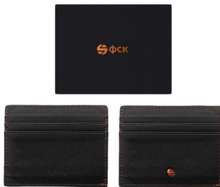
Кардхолдер для клиентов