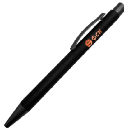
Ручка брендированная с логотипом ФСК для клиентов