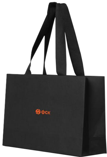
Бумажный брендированный пакет для клиентов